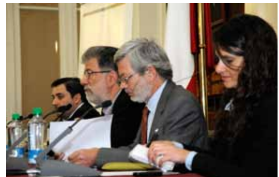
El seminario fue el hito final de un proyecto de investigación que se desarrolló por más de ocho meses.