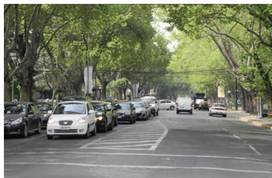
Los sectores vulnerables podrían revitalizarse de manera importante si se aplicaran los mismos estándares de diseño y calidad que tiene, por ejemplo, la avenida Pedro de Valdivia.