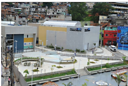
Centro cívico ubicado en el corazón de un sector vulnerable de Río de Janeiro. Es un espacio educativo, cultural y deportivo con estándar de ciudad moderna.

No es posible reducir la segregación urbana desde la lógica sectorial y centralista con que opera hoy el Estado.